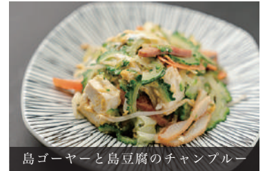
島ゴーヤーと島豆腐のチャンプルー