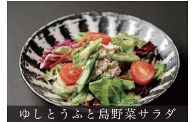
ゆしとうふと島野菜サラダ