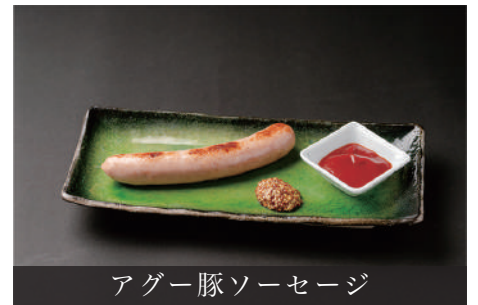
アグー豚ソーセージ