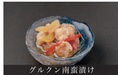
グルクン南蛮漬け

グルクン南蛮漬け ¥450 Deep-fried Pickled Gurukun (Okinawa Prefecture Fish)