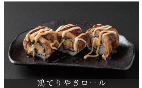
鶏てりやきロール