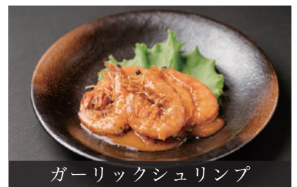
ガーリックシュリンプ