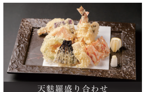
天麩羅盛り合わせ

Assorted Tempura (2 Okinawa Tiger Prawns, 2 White-fleshed Fish, 5 Vegetables)