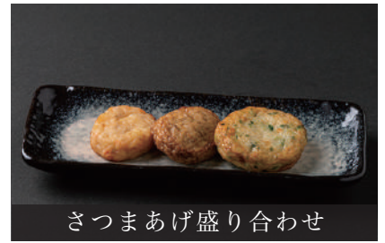
さつまあげ盛り合わせ