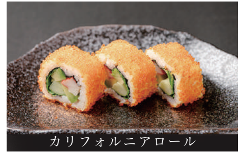
カリフォルニアロール

水曜・日曜は寿司カウンター定休日のためご提供できません Sushi is not available every Wednesdays and Sundays.