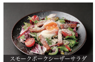
スモークポークシーザーサラダ