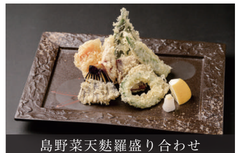
島野菜天麩羅盛り合わせ

入荷状況により県外の野菜を使用することがあります Depending on availability, vegetables from other prefectures may be used.