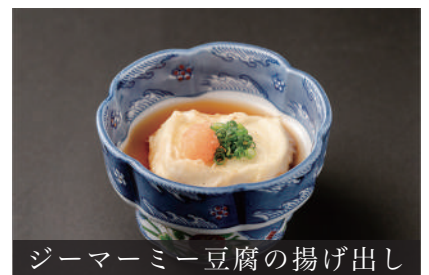
ジーマーミー豆腐の揚げ出し