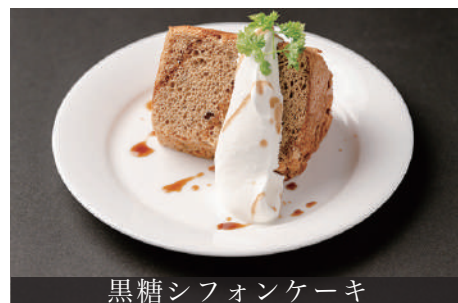
黒糖シフォンケーキ