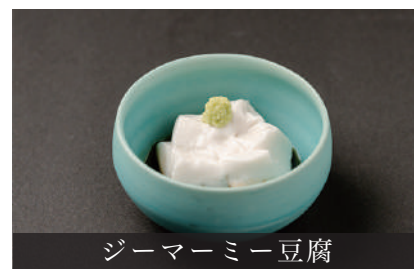
ジーマーミー豆腐