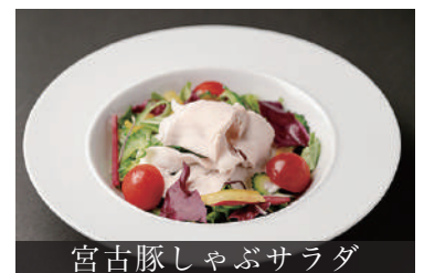
宮古豚しゃぶサラダ