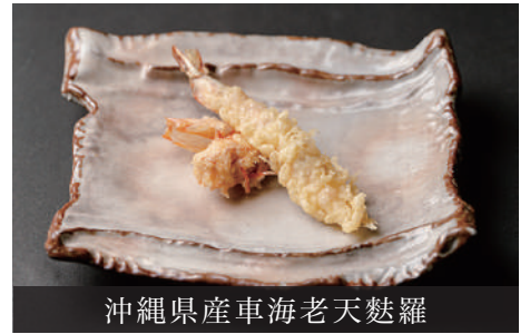
沖縄県産車海老天麩羅

沖縄県産車海老天麩羅 (1本から) ¥1,100 Okinawa Tiger Prawns Tempura (From 1 piece)