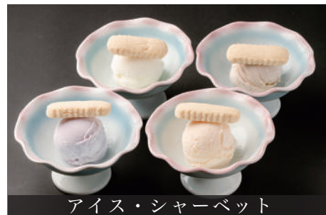
アイス・シャーベット