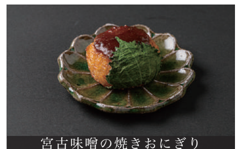
宮古味噌の焼きおにぎり

Mozuku ( Vinegared Seaweed ) and Sea Lettuce