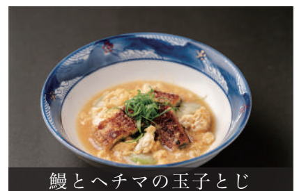
鰻とヘチマの玉子とじ