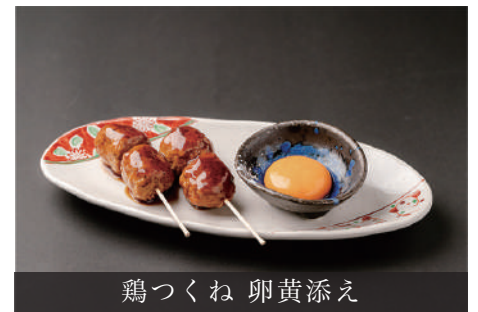
鶏つくね 卵黄添え