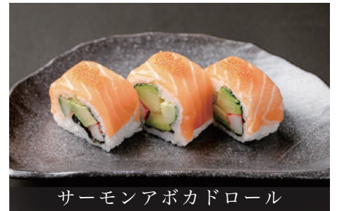
サーモンアボカドロール