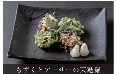
もずくとアーサーの天麩羅

もずくとアーサーの天麩羅 (各2個) ¥1,400 Mozuku and Sea Lettuce Tempura (2 pieces each)