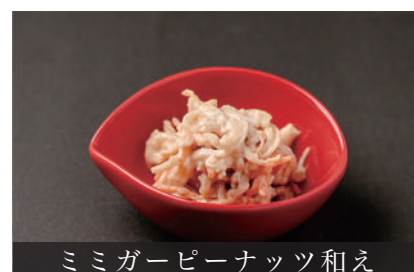
ミミガーピーナッツ和え

小鉢四品 ¥1,600 (4 Pieces) 小鉢五品 ¥2,000 (5 Pieces)