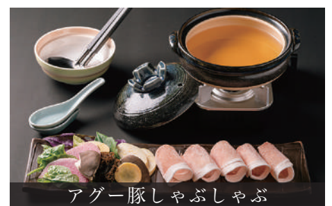
アグー豚しゃぶしゃぶ