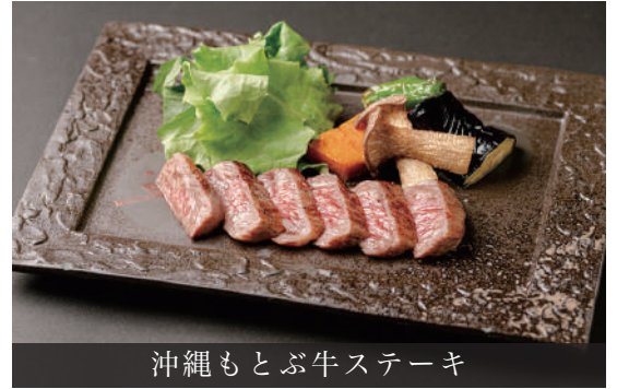
沖縄もとぶ牛ステーキ