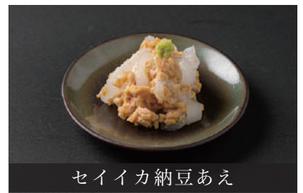
セイイカ納豆あえ