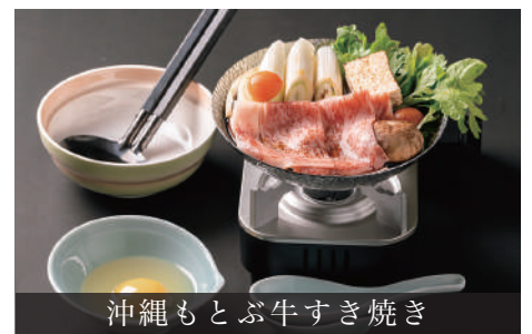
沖縄もとぶ牛すき焼き